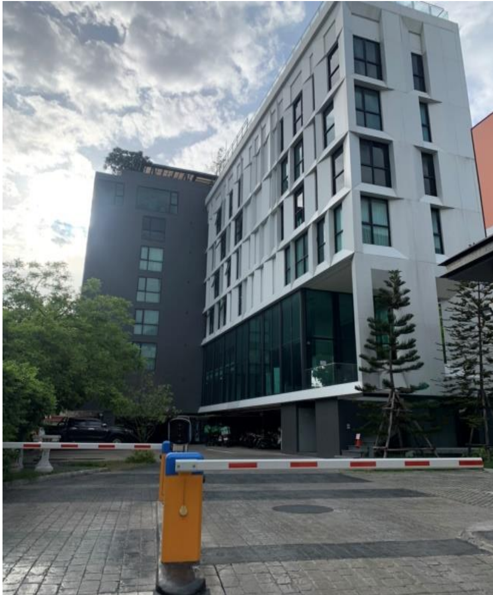
รูปที่ 1-3 ภาพปัจจุบันของโครงการ

ปัจจุบันโครงการอยู่ในช่วงเปิดดำเนินการ และได้รับใบรับรองการก่อสร้าง(อ.6)เรียบร้อยแล้ว ดังแสดงใน ภาคผนวก ก-3